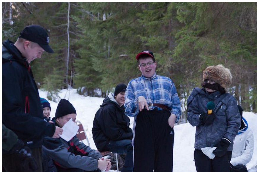
Sketsihahmot naurattivat yleisöä