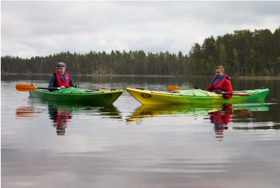
Rotomod-kajakit otettiin käyttöön juhlaileiri Humulla 2017.

Erävalkean varustukseen kuuluu Taimen 465 – soutuvene. Tämä vene oli alun perin toisen lippukunnalla olleen kämpän vene, mutta kun siitä luovuttiin, veneen sijainti vaihtui Valkeisen rannalle. Soutuveeneen lisäksi Erävalkeasta löytyy kanootteja ja kajakkeja. Neljä inkkarikanoottia, joista kolme on tehty aikanaan kansalaisopiston kurssilla. Kaksi Rotomod Espresso kajakkiyksikköä hankittiin Vuorineuvos Erik Rosenlewin säätiön avustuksella ja kolmas kajakki saatiin lahjoituksena. Pihapiiristä löytyy myös muutama nuotiopaikka.