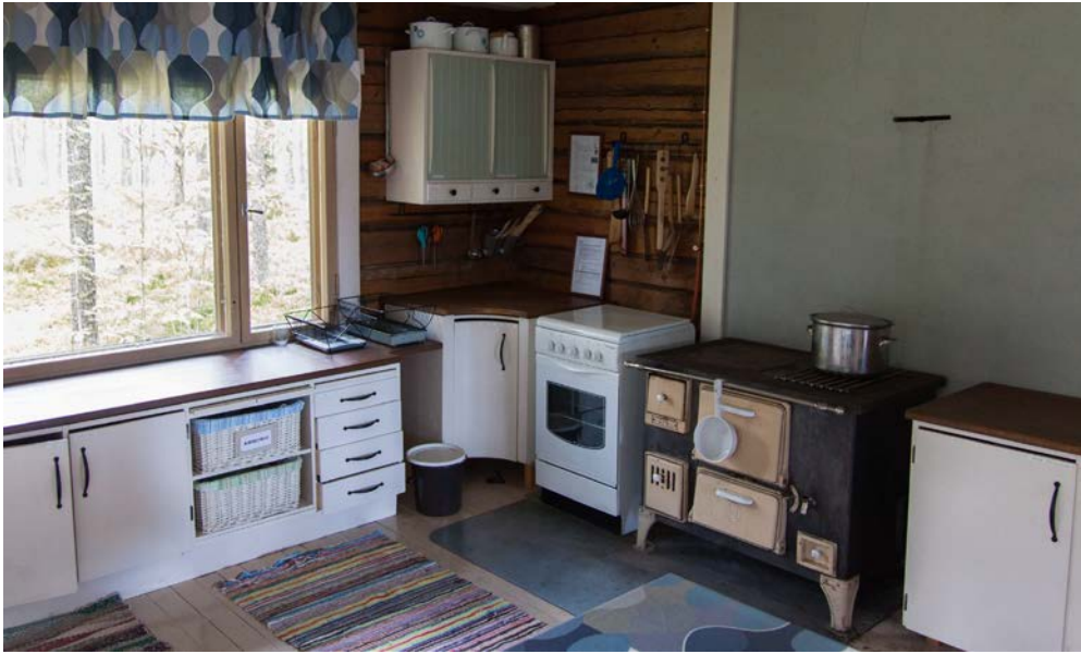
Keittiöstä löytyy jääkaappi pakastelokerolla sekä kaasu- ja puuliedet.

Vuosina 2007–2008 rakennettiin uusi hieno ruokailu- ja toimintakatos, joka sai kalusteet 2010. Kompostoiva puusee nousi vuonna 2009. Viimeisimpänä on uusittu majan kuisti 2014 ja penkit tehtiin 2015. Uudet turvallisemmat liekinvartijoilla varustetut kaasuvalot asennettiin 2016. Vuosien 2017–2018 aikana Erävalkeaan rakennettiin uusi rakoliiteri polttopuiden säilytykseen. Liiterin rakentamiseen saimme avustusta Parkanon Säästöpankkisäätiöltä ja Parkanon Kaupungilta. Itse rakentaminen tapahtui talkoilla sekä osana vuoden 2017 syysleirin ohjelmaa. Lähivuosina on tarkoitus tehdä seuraava peruskunnostus rakennuksille, jossa nostetaan saunaa ylemmäs ja tämän jälkeen on vuorossa mökin oikaisu ja katon uusinta. Kunnostustyöt majalle on tehty talkoilla, joissa partiolaisten kotijoukoilla on merkittävä rooli.