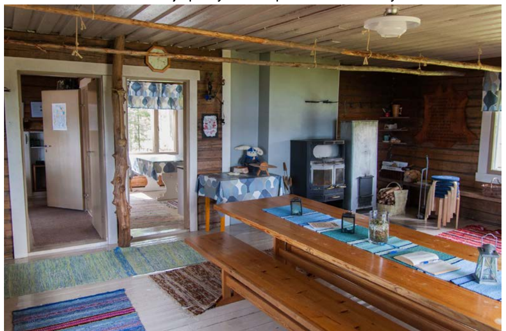
Tuvan lämmitykseen on takka ja Porin Matti Makuulavereilta löytyy tilaa 4-6 yöpyjälle ja lattialle mahtuu lisää.

Talkoot kämpällä järjestetään kaksi kertaa vuodessa, keväisin ja syksyisin. On tärkeää, että partioperheistä päästään ainakin toisiin talkoisiin, näin vuosittaiset siivoukset ja puutyöt sekä pienet kunnostustyöt saadaan mukavasti ja nopeasti tehtyä ja maja pysyy hyvässä kunnossa.