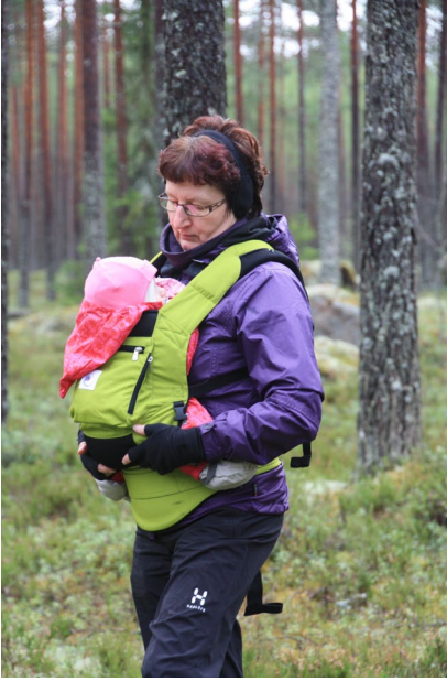
Sieniretkellä Alkekiamvuorella syksyllä 2012

Syksyllä kävimme monilla marjastus- ja sieniretkillä. Koska tyttö oli jo vähän isompi, häntä kannettiin rintarepussa. Sinäkin matka taitui mukavasti välillä hereillä ja välillä nukkuen. Sienien ja marjojenkin poimiminen onnistuu yhtä hyvin rintarepun tai kantoliinan kanssa, koska ne jättävät kädet vapaiksi, mutta silti tukevat lasta hyvin.