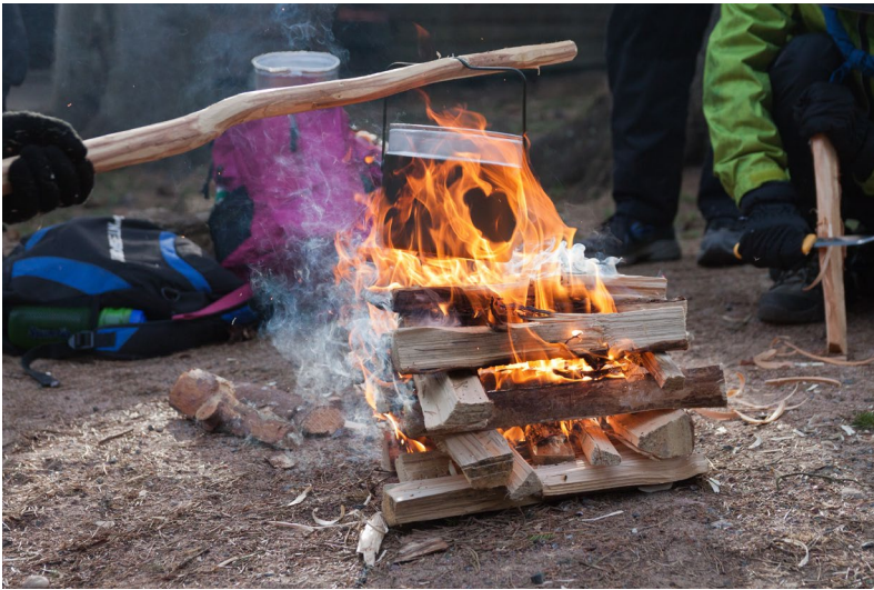
Vesi kiehumassa pakissa nuotiolla

Aloitustehtävässä vartiot saivat läjän halkoja. Tehtävänä oli sytyttää nuotio ja kiehauskea kepin nokassa pakissa vettä. Halot olivat sen verran isoja, että hakkasimme niitä kirveellä halki. Opimme myös uuden tavan halkaista puita puukon ja toisen halon avulla. Osa vuoleskeli kiehisää. Tämän jälkeen koottiin nuotio. Pienen avustuksen jälkeen nuotion puut saatiin koottua niin, että kiehisten avulla nuotio syttyi, eikä kova tuuli saanut sitä puhallettua sammuksiin. Pakin pohjalle laitettiin vettä ja pakkia pidettiin kepin avulla nuotion päällä.