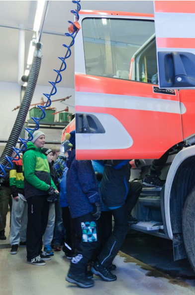
Paloauton kyytiin oli jonoa

Vielä ennen kotiin lähtöä pääsimme kurkkaamaan ambulanssiin ja ensivasteen henkilökunta kertoi meille nopeasti työstään.