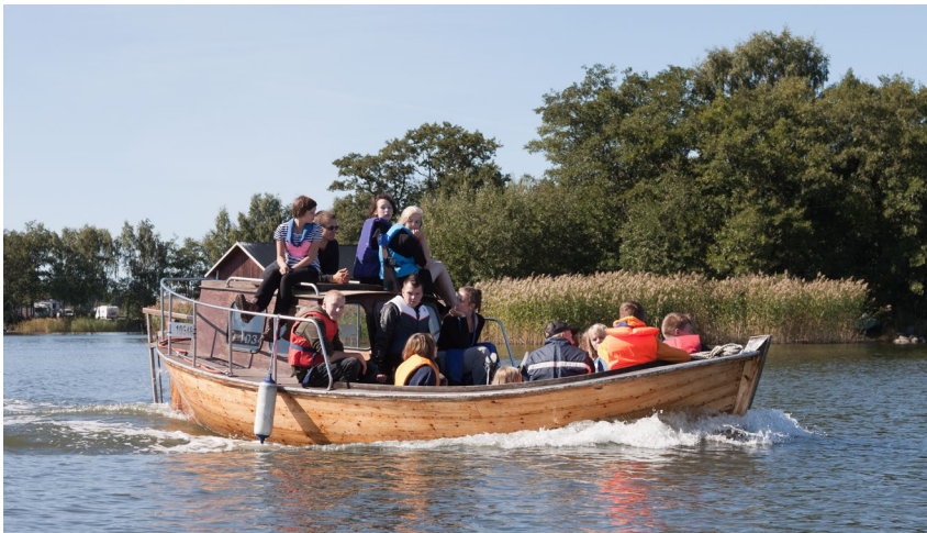
KiPalaisia samoajien ROK -koulutuksessa elokunssa 2013 Merikarviolla