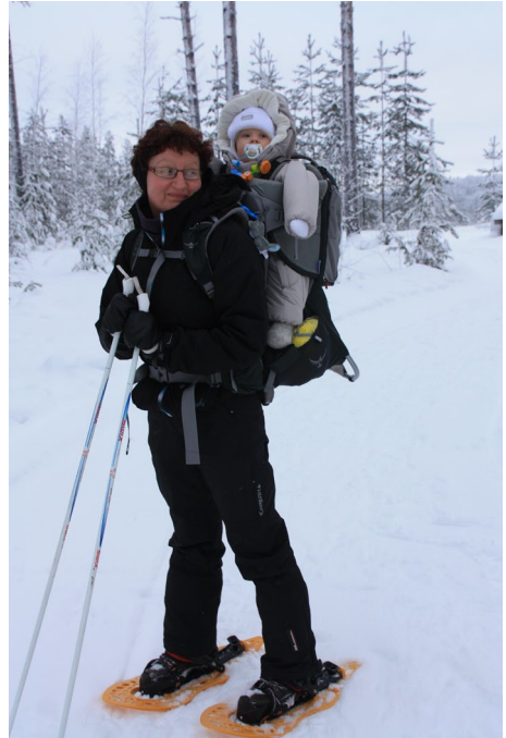
Lumikenkäilemässä Pärnävaaralla Itä-Suomessa talvella 2013

Talvella retkeilimme paljon metsässä lumikengillä. Huomasimme, että talvella täytyy lapsen jalat ja kädet pukea tosi lämpimästi, koska ne ”roikkuvat” rinkan ulkopuolella eikä lapsi pääse niitä istuessaan paljoakaan liikuttelemaan. Muu vartalo on rinkassa hyvin suojassa, mutta vaatetuksen täytyy olla silti lämmintä ja tuulenpitävää. Tytön pään kellahdettua omaan takaraivoon huomaa, että kyytiläinen on nukahtanut.