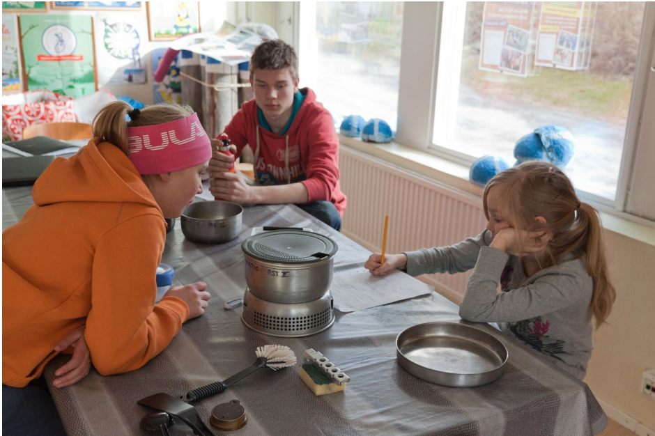
Omenat jutun teossa