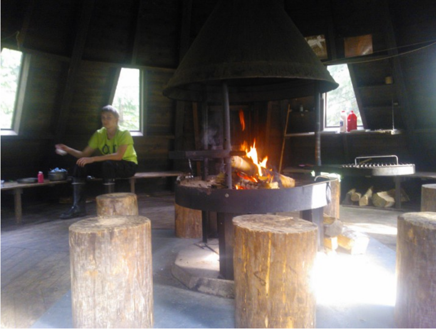
Kodan sisällä oli tilaa todella paljon

Sunnuntaina oli taas pilvistä ja viileää, siis mainio vaellus keli. Suuntana oli Kolin hotelli ja luontokeskus. Alkutaival oli helppoa laskeutumista Ryläykseltä alas. Kun pääsimme seuraavan lähteen luo, otimme sieltä vettä, koska pullot olivat tyhjentyneet aamun kävelyn aikana. Toki keitimme veden kunnolla, koska lähteellä oli jälleen ilmoitus, ettei vesi kelpaa juotavaksi ilman keittämistä. Jälkikäteen ajatellen reissuun olisi pitänyt varata mukaan vedenpuhdistustabletteja, jolloin olisi pärjännyt vähemmällä kantamisella.