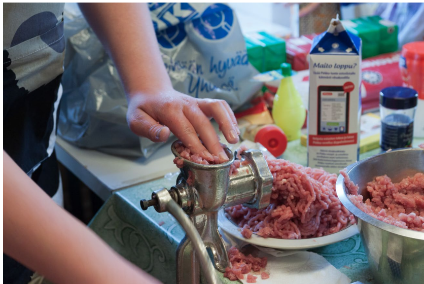
Huuhkajapata valmistui ilman konevoimia

Lounaaksi saamamme Huuhkajapata oli kyllä erinomaista ja lukijalle tiedoksi, se ei ollut oikeasta huuhkajasta tehtyä. Savustuspönttökin toimivat melkein, ainoa ongelma oli, että niitä käytettäessä oli erittäin suuri vaara muuttaa pönttö avonuotioksi. Niinpä käytimme päivällisellä suunnitelma B:n kaloja savustettaessa. Ennen päivällistä oli kuitenkin vuorossa Lahti-jahti eli rastirata, jossa pääsimme arvioimaan etäisyyksiä, opettelemaan ensiapua, näpräämään solmuja sekä polttamaan Kipan huutotaulua. Päivä oli täynnä tohinaa, meteliä, iloa, onnistumista ja pari haavaakin tuli, kuinkas muuten.