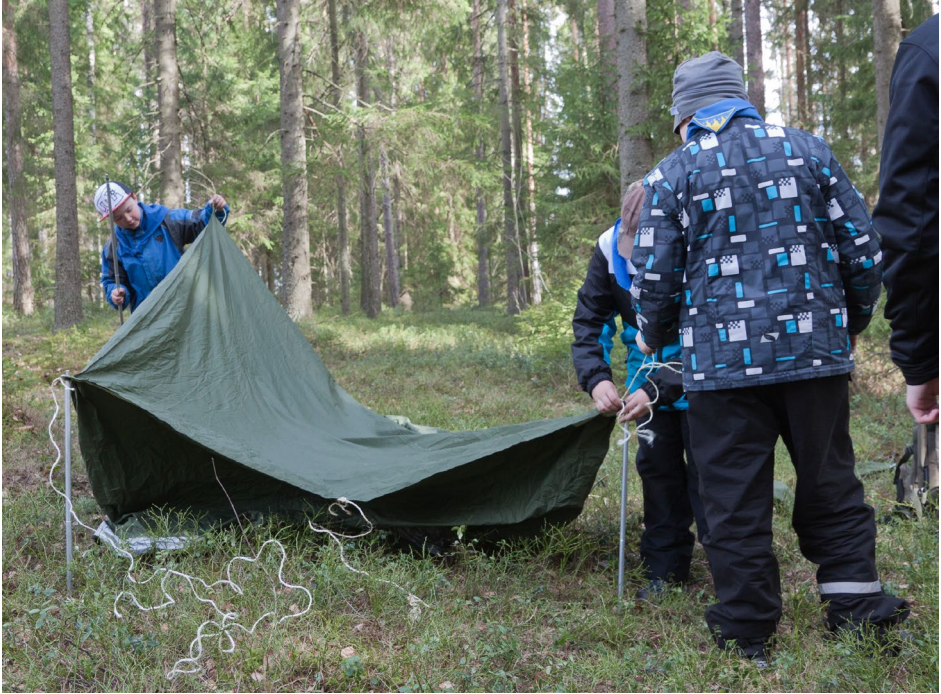
Laavua kasaamassa Perinat-vartio

Rastilla meidän piti pystyttää laavu metsään. Homma oli aika helppo, vähän rastihenkilöt auttoivat. Tuuli oli niin kova, ettei laavu ehkä olisi koko yötä pysynyt pystyssä. Kun laavu oli pystyssä, piti ryhmän huutaa partiohuuto, jonka jälkeen laavu piti purkaa.