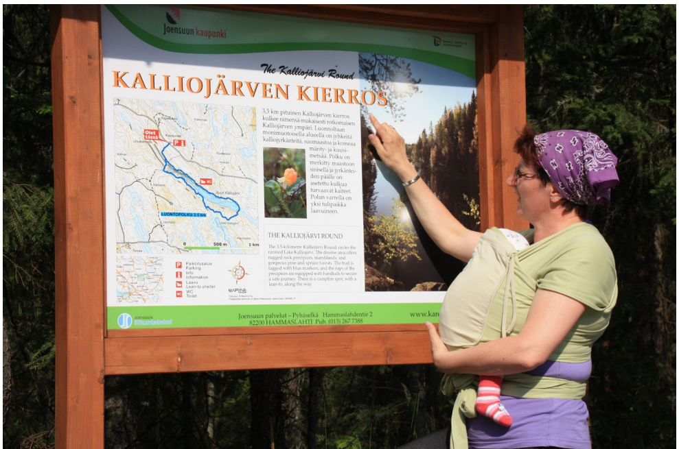
Lähdössä Kalliojärven kierrokselle

Ensimmäinen eräretkemme tehtiin tytön ollessa 7 viikon ikäinen. Oli heinäkuun loppu ja Itä-Suomessa + 30 astetta hellettä. Patikoimme Kalliojärven kierroksen Joensuun kupeessa. Tyttö kulki mukanamme kantoliinassa vuoroin äitinsä ja minun vatsan päällä tyytyväisenä melkein koko ajan nukkuen. Hiki kyllä tuli ja sekä kantajien että kannettavan paidat oli märkinä johtuen osaksi helteestä ja myös siitä että lapsi on ihan liki koko ajan. Vaipan vaihto ja eväiden tankkaus suoritettiin laavulla.